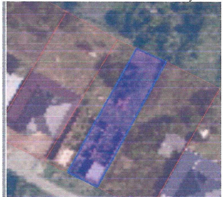
Схема расположения ЗОУИТ 23:34-6.908 на публичной кадастровой карте (фрагмент)